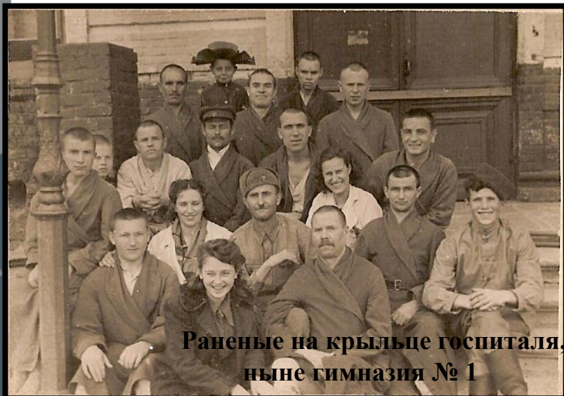
Раненые на крыльце госпиталя, ныне гимназия № 1

Огромную роль в годы Великой Отечественной войны играли действующие Эвакуационные госпитали. Только на территории города их было более 30. Для них были выделены лучшие помещения школ, институтов, гостиниц и санаториев. В 1941 году средняя школа № 16, которая в 30-е гг. XX века располагалась в здании гимназии, была переведена в другое место, а в здании разместился эвакогоспиталь № 3931. Фонды музея располагают многими фотографиями медицинских работников, раненых госпиталя, списками умерших и захороненных на Воскресенском кладбище г. Саратова.