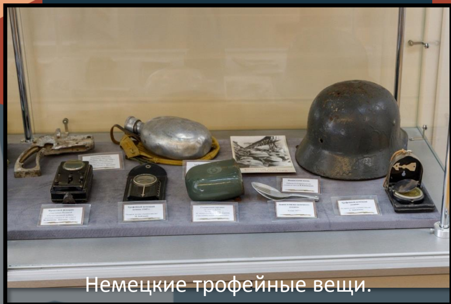
Немецкие трофейные вещи. Подарены учащимися школы