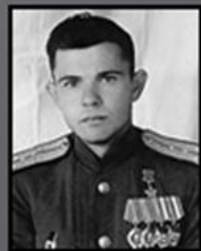
Александр Южилин Герой Советского Союза