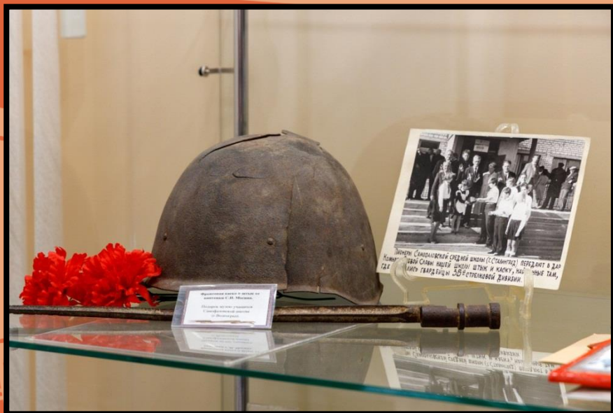
Каска и штык. Экспонаты подарены учащимися Самофаловской средней школой г. Волгограда.

Группы рассказывают о выполнении задания.