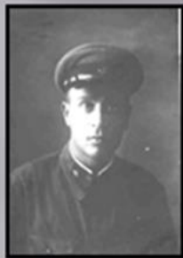
Николай Ветлущий Погиб в 1943 г.